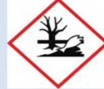
Berbahaya untuk kehidupan Akuatik