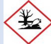
Berbahaya untuk kehidupan Akuatik